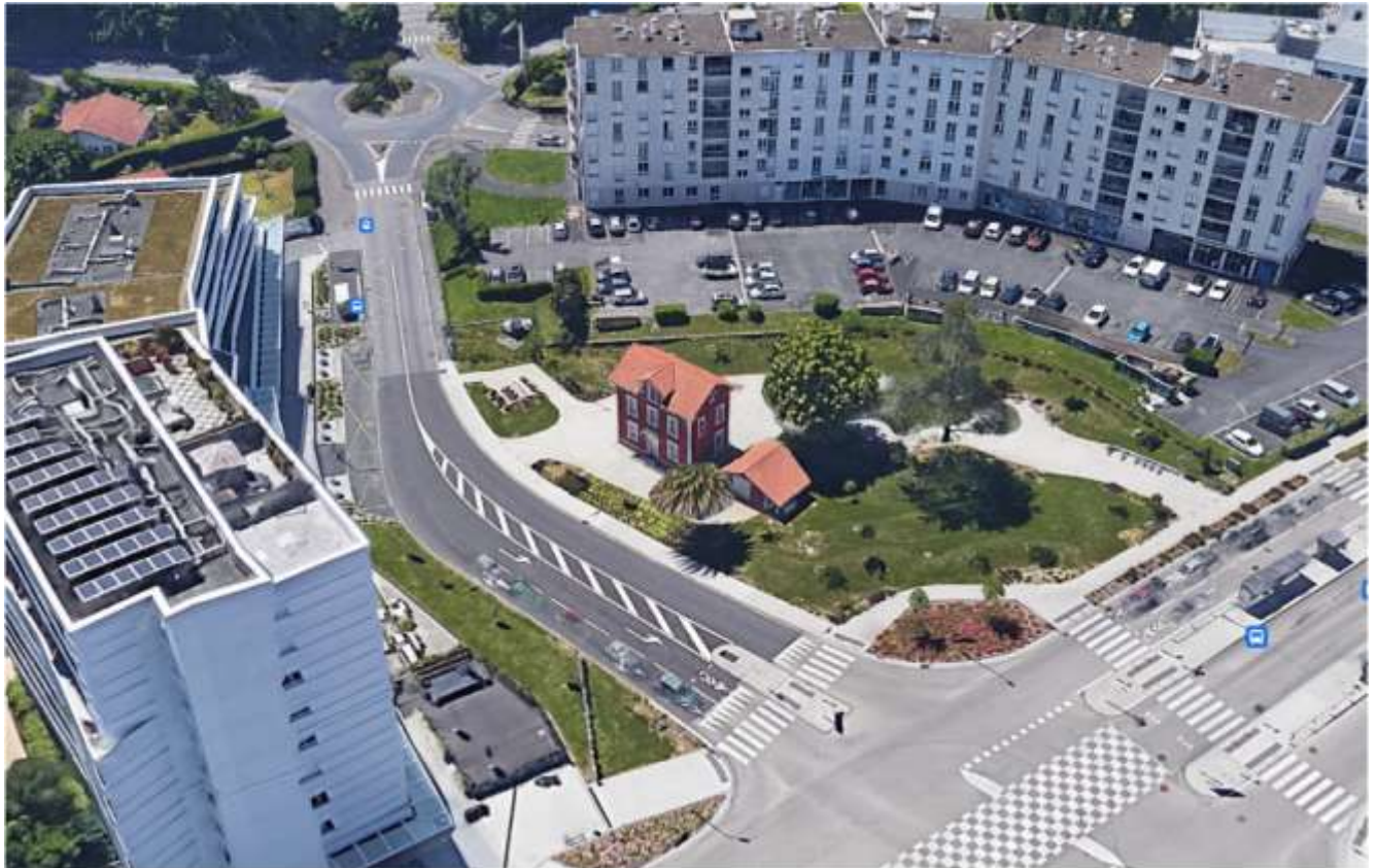
Vue aérienne 2020