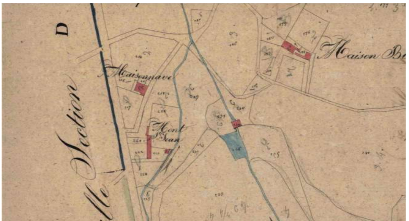
Plan cadastral 1831