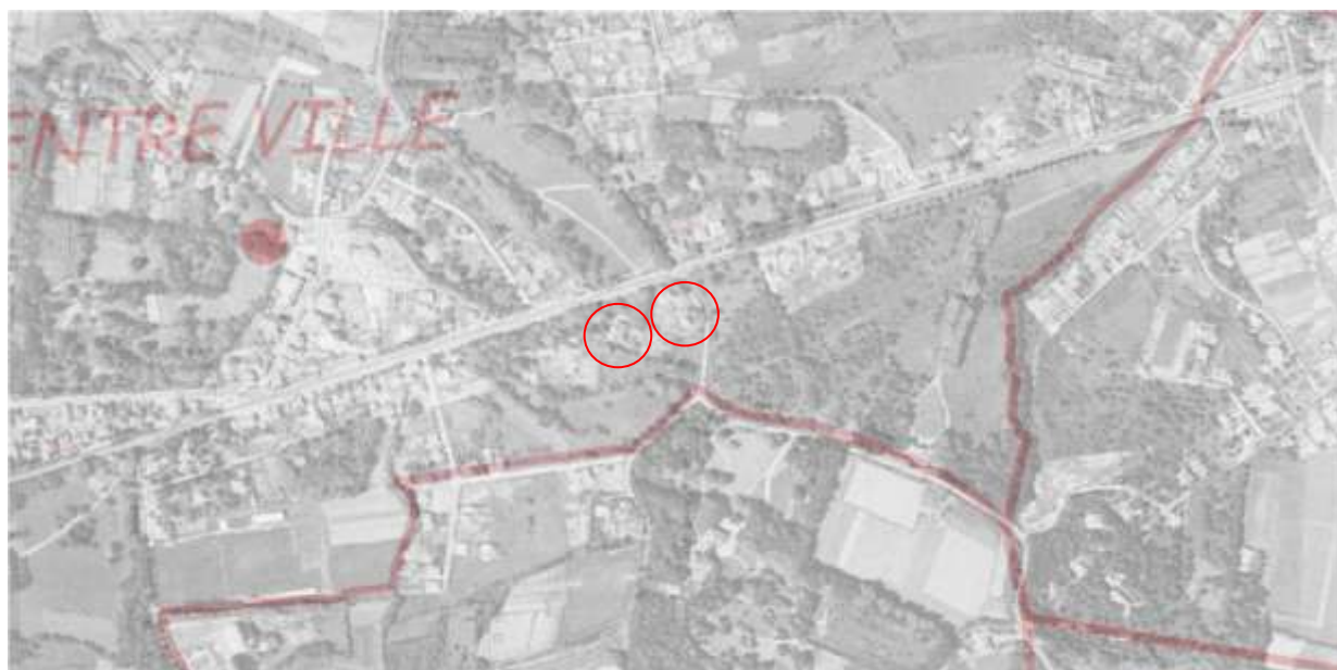
Photo aérienne 1938