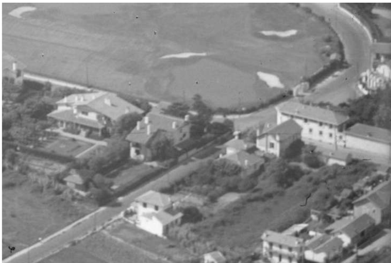
La villa Fourvière a manifestement été démolie, voire fortement remaniée