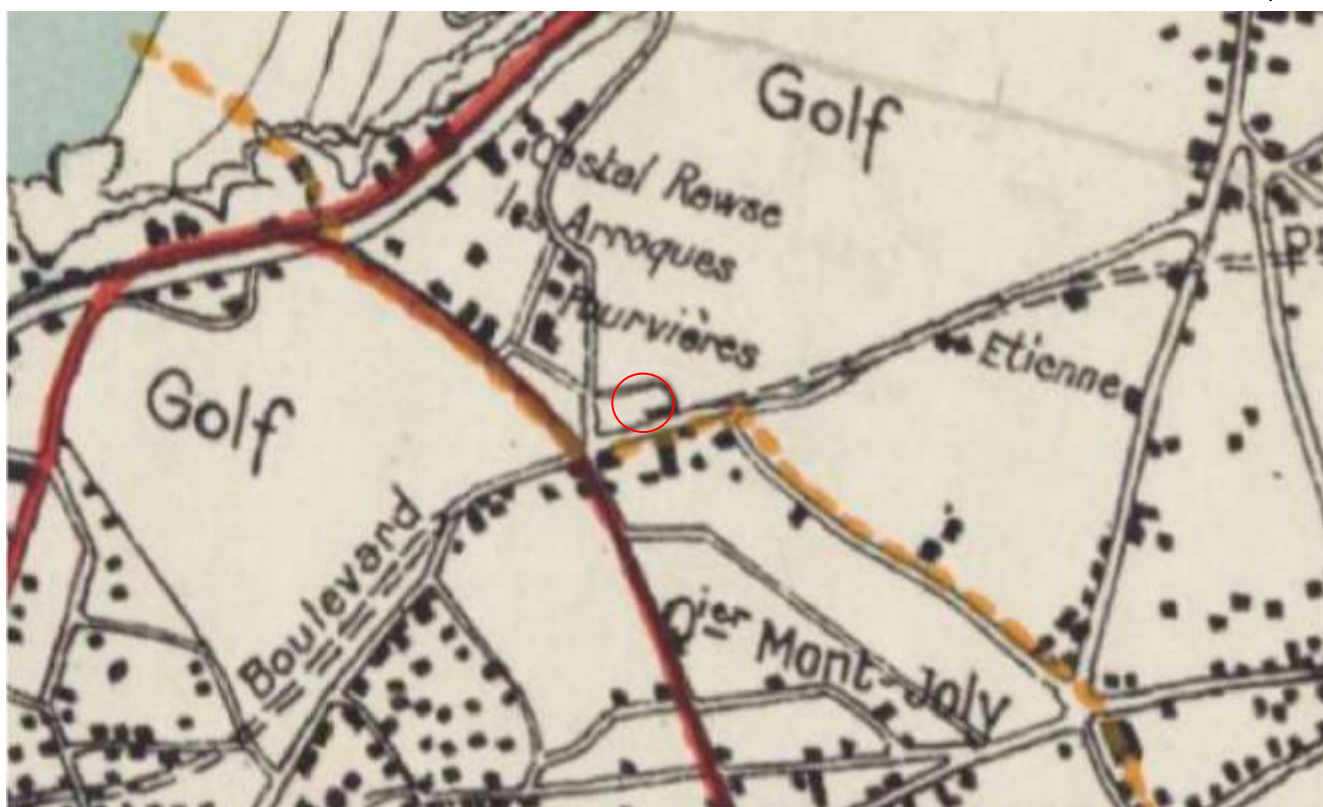
Carte du syndicat d'initiative 1926