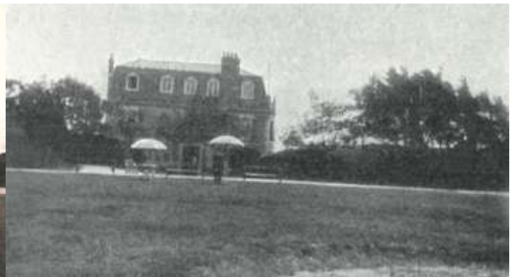
C'est le Club-house, qui est parfaitement agencé. En face, et près du green à domicile il y a une terrasse ; et « Le thé sur la terrasse » est une institution populaire actuellement.