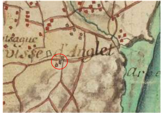
Carte de Roussel (1713) pas dénommée