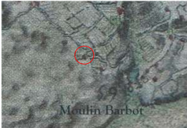
Carte de Claude Masse (1700) pas dénommée