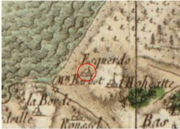
Carte de Cassini (1768) dénommée ESQUERDO la représentation cartographique correspond à une métairie ou ferme